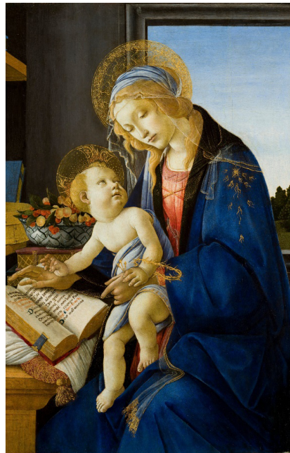
Рис. 2. С. Боттичелли «Мадонна с книгой, или Мадонна дель Libro» (ок. 1483 г.), музей Польди-Пеццоли, Милан, Италия

тексты, предназначенные для молитвенного общения мирян с Богом, Богородицей и святыми, то дидактический «призыв» учиться грамоте становится еще более очевидным. Иные версии иконографии Марии с книгой представлены творениями Рафаэля «Мадонна Конестабиле» 1505 г., Джорджоне «Читающая мадонна» 1510 г. и др.