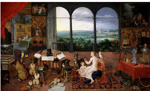
Рис. 10. Я. Брейгель Старший «Слух» (1618 г.), Музей Прадо, Мадрид, Испания Fig. 10. J. Bruegel the Elder “The Rumor” (1618), Prado Museum, Madrid, Spain

Поскольку в мифологической живописи книга, как правило, используется в качестве атрибута-символа, то работы этого жанра пересекаются с аллегорическими произведениями. Конечно, использование книги как аллегории встречается и за пределами мифологических сюжетов. К одним из ранних примеров такого рода может быть отнесена картина Я. Брейгеля Старшего (рис. 10) весьма детализированно