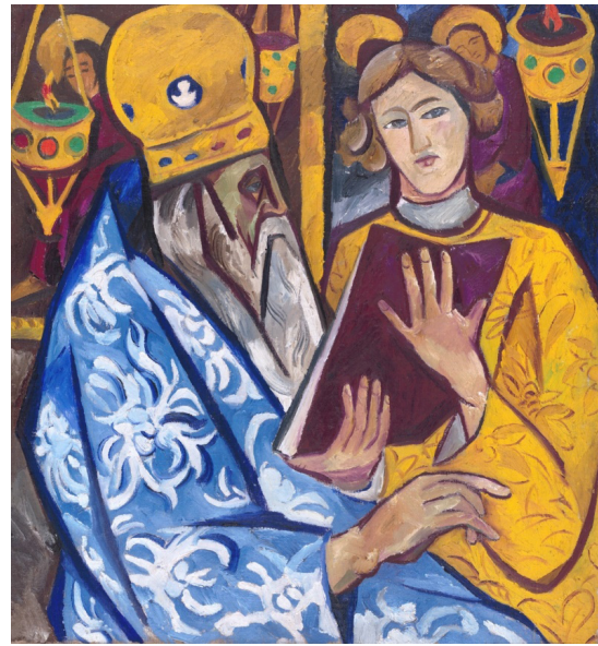
Рис. 5. Н. С. Гончарова «Архиерей» (1911), Государственная Третьяковская галерея, Москва, Россия

Религиозные мотивы можно обнаружить в бытовых сценах. Например, в картине В. Е. Маковского «Отдых на пути в Киев» 1888 г. изображена молодая крестьянка, угощающая обедом странствующего монаха. На столе