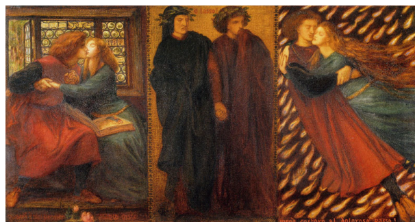
Рис. 12. Д. Г. Россетти «Паоло и Франческа да Римини» (1862 г.), Национальная галерея Виктории, Мельбурн, Австралия Fig. 12. D. G. Rossetti “Paolo and Francesca da Rimini” (1862), National Gallery of Victoria, Melbourne, Australia

Как отмечает Н. Э. Микеладзе (2005, с. 285), многие герои театральных произведений XVI в.,