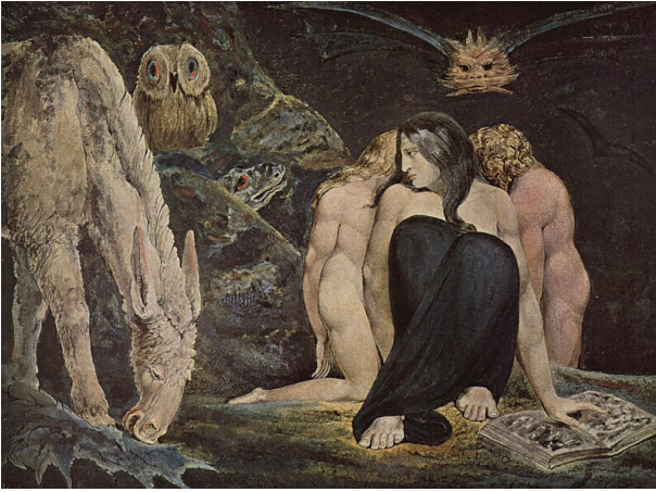
Рис. 9. Уильям Блейк «Геката» (1795 г.), Галерея Тейт, Лондон, Великобритания Fig. 9. William Blake “Hecate” (1795), Tate Gallery, London, United Kingdom

в своем кабинете» 1635 г.). Нередко эти богини предстают в окружении муз, как на картинах «Минерва и музы» Ж. де Стелла 1450 г., «Афина и музы» Ф. Флориса 1560 г. и Г. Роттенхаммера 1610 г. С книгой иногда изображалась Геката – богиня тайного знания, магии, одним из ее атрибутов выступает раскрытый «волшебный» фолиант, как у У. Блейка (рис. 9).