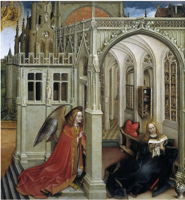
Рис. 1. Р. Кампен «Благовещение» (1425–1430 г.), Музей Прадо, Мадрид, Испания

В европейской живописи в произведениях старых мастеров с книгой нередко изображается Дева Мария. По сведениям А. Киселевой, «самое раннее изображение читающей Богородицы из тех, что сохранились, относится ко второй половине IX века: это резьба на шкатулке из слоновой кости» (Киселева, 2017). В религиозную живопись мотив Марии с книгой попал из апокрифов, в которых приводится история о том, что в момент появления архангела Гавриила «Мария читала книгу пророка Исаии с предсказаниями о рождении Мессии» (Толова, 2009). Именно в сцене Благовещения Марию нередко изображают с книгой в руках (рис. 1).