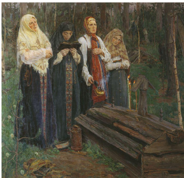
Рис. 7. В. А. Кузнецов «Канун» (1909 г.), Пензенская областная картинная галерея, Пенза, Россия

Большое распространение получило изображение книги в живописных произведениях, связанных с темой старообрядчества. Это и исторические полотна, посвященные началу раскола и книжной споре (А. Д. Кившенко «Патриарх Никон представляет новые книги на церковном соборе 1654 г.» 1880 г., В. Г. Перов «Никита Пустосвят. Спор о вере» 1881 г., С. Д. Милорадович «Черный собор. Восстание Соловецкого монастыря против новопечатных книг в 1666 г.» 1885 г., С. В. Иванов «Во времена раскола» 1909 г. с изображением изъятия старообрядческих книг); и портреты читающих старообрядцев, ведь в их среде всегда было много грамотных людей, а начитанность относилась к бесспорным достоинствам (М. П. Боткин «Старовер» 1877 г., И. С. Куликов «Старик за чтением» 1911 г., Т. П. Азовсков «Читающий псалтырь» 2013 г.); и изображение духовных бесед, богословских диспутов (Д. Е. Жуков «Спор о вере» 1867 г.), религиозных обрядов (В. А. Кузнецов «Канун» 1909 г. (рис. 7) и «Божьи люди» 1917 г., И. С. Горюшкин-Сорокопудов «В храме», 1910-е гг., В. П. Рассохин «За упокой» 1990-е гг.).