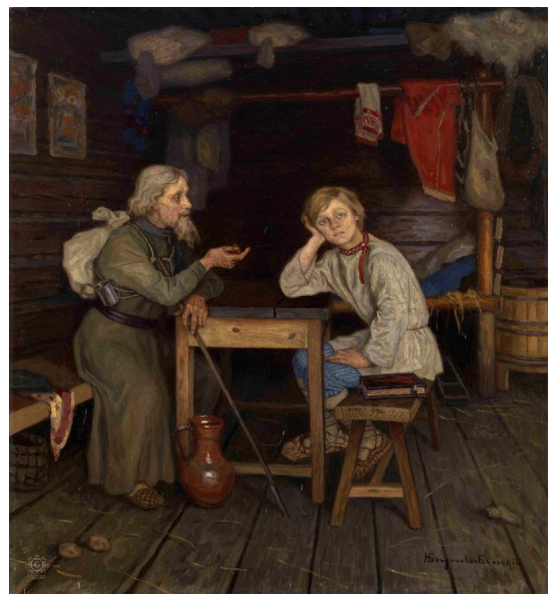
Рис. 6. Н. П. Богданов-Бельский «Будущий инок» (1889 г.), Латвийский Национальный художественный музей, Рига, Латвия

лежат паломнические дары: крестик, четки, религиозные брошюры. Хозяйка внимательно читает одну из них, слушая разъяснения монаха. Другой пример – дипломная работа Н. П. Богданова-Бельского (рис. 6), где показана беседа умудренного опытом седовласого монаха-странника и мальчика-подростка, мучительно размышляющего о своем жизненном выборе. Примечательно, что на скамье, рядом с юношей, лежит книга.