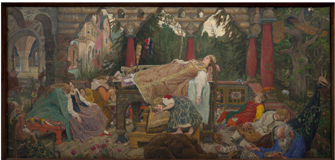
Рис. 14. В. М. Васнецов «Спящая царевна» (1926 г.), Государственная Третьяковская галерея, Москва, Россия

На рубеже XVIII–XIX вв. книга становится объектом изображения в русской религиозной