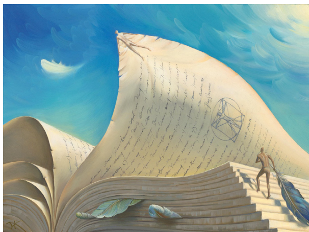
Рис. 11. В. Куш «Мечта и иллюзия» (2009 г.), частное собрание Fig. 11. V. Kush “Dream and Illusion” (2009), private collection

Объединяет столь различные произведения использование книги в качестве символа, воплощающего в конкретной зримой форме понятия, идеи или даже целые философские концепции, так как книга за долгую историю своего существования успела стать очень емким и многозначным художественным образом.