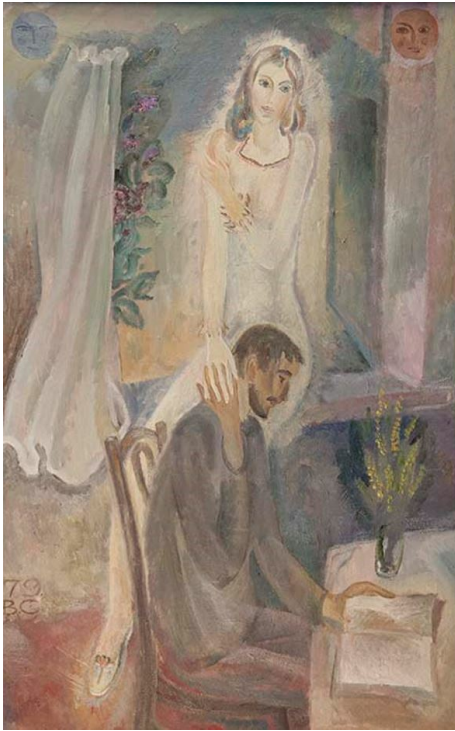
Рис. 13. В. М. Собинков «Мастер и Маргарита» (1979 г.), Калужский музей изобразительных искусств, Калуга, Россия