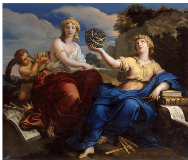
Рис. 8. Л. Булонь мл. «Музы Урания и Мельпомена» (1681 г.), Версальский дворец, Франция

Начиная с древнегреческих фресок и мозаик со свитками нередко изображаются музы. Намеченная иконографическая традиция получила развитие в живописи XVII–XIX вв. Свиток или кодекс сопровождает музу истории Клио (Дж. Бальоне 1620 г.), музу эпической поэзии, науки и философии Каллиопу (Дж. Бальоне 1620 г., Дж. Фаньяни 1869 г.), музу торжественных гимнов Полигимнию (Дж. Бальоне 1620 г.), музу лирической поэзии и музыки Эвтерпу (Я. Хандман 1775 г.). Мельпомена с нотами в окружении Эрато и Полигимнии предстает на картине Л. Эсташа 1655 г. Со стопкой книг и раскрытыми нотами изобразил музу астрономии Уранию и музу трагедии Мельпомену Л. Булонь мл. (рис. 8). Произведения с изображением муз нередко использовались для оформления дворцовых интерьеров, чаще всего тех залов, где устраивались концерты, интеллектуальные беседы, салонные встречи, а также рабочих кабинетов.