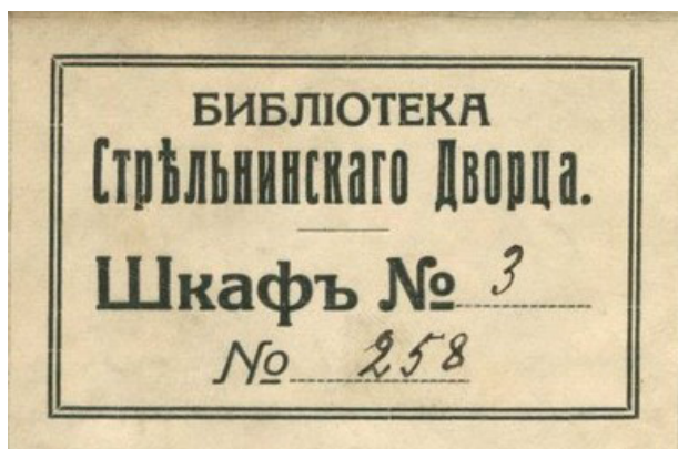
Рис. 3. Экслибрис Стрельнинского дворца Fig. 3. The ex-libris of the Strel'ninsky Palace

Десятки томов с экслибрисом Стрельнинского дворца (рис. 3) занимают полки шкафов в ВИБ ГШ ВС РФ. Стрельну император Павел I в 1797 г. пожаловал сыну – великому князю Константину Павловичу. С 1831 г. дворцом владели великий князь Константин Николаевич, после его смерти в 1882 г. – его вдова, великая княгиня Александра Иосифовна, затем, с 1911 г. – великий князь Константин Константинович, последний владелец – великий князь Дмитрий Константинович [Герасимов, 2007]. Встречаются единичные